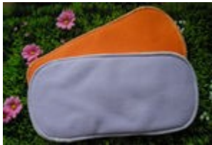
Doublure ou insert en coton